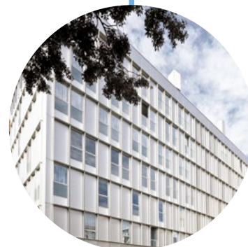
LA SALLE TECHNOVA