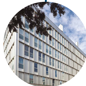
LA SALLE TECHNOVA