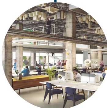
INTERNET OF THINGS INSTITUTE OF CATALONIA